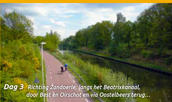
Dag 3 Richting Zandoerle, langs het Beatrixkanaal, door Best en Oirschot en via Oostelbeers terug...