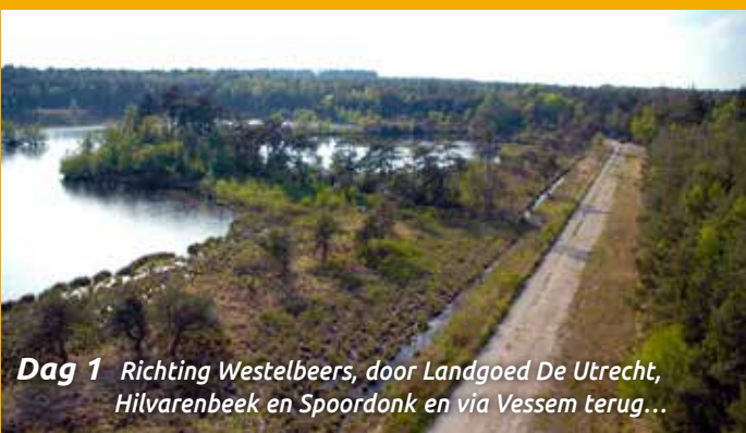
Dag 1 Richting Westelbeers, door Landgoed De Utrecht, Hilvarenbeek en Spoordonk en via Vessem terug...