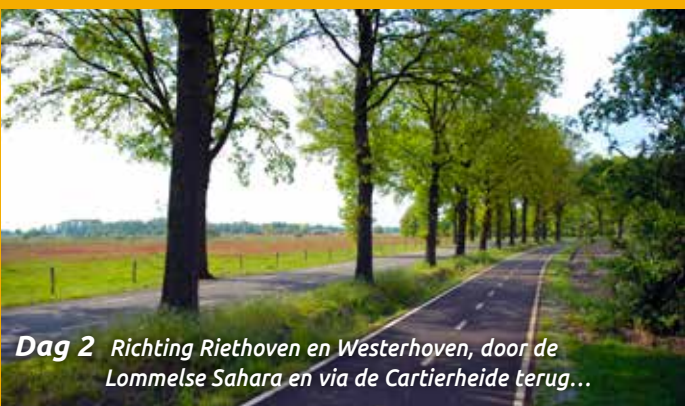
Dag 2 Richting Riethoven en Westerhoven, door de Lommelse Sahara en via de Cartierheide terug...